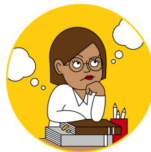
Leading with a Meaning