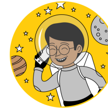
Leading from a Distance