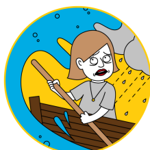
Leader in Rough Waters