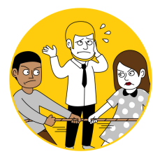
Dream Team in Process