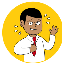
Born to Lead