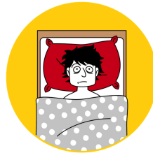
Sleepless in Seattle