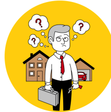
Lost in Transition